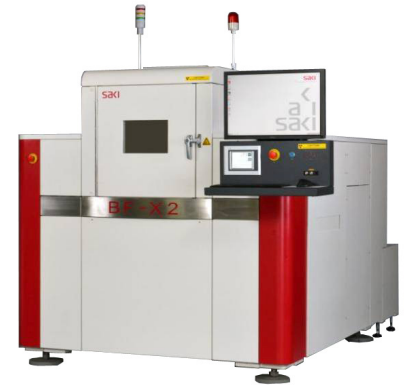
BF-X2, 3D-Planar X-Ray System

Sie erhalten für jeden Inspektionsauftrag einen detaillierten Rapport mit ausführlicher Bewertung der Zustände der inspizierten Stellen.